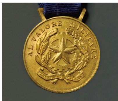
Medaglia d'oro al Valor Militare