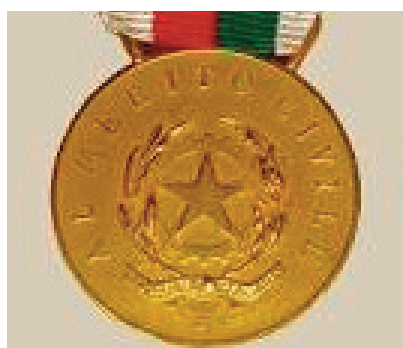
Medaglia d'oro al Merito Civile